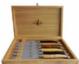
C S6C REG