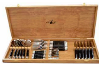
C S24 C