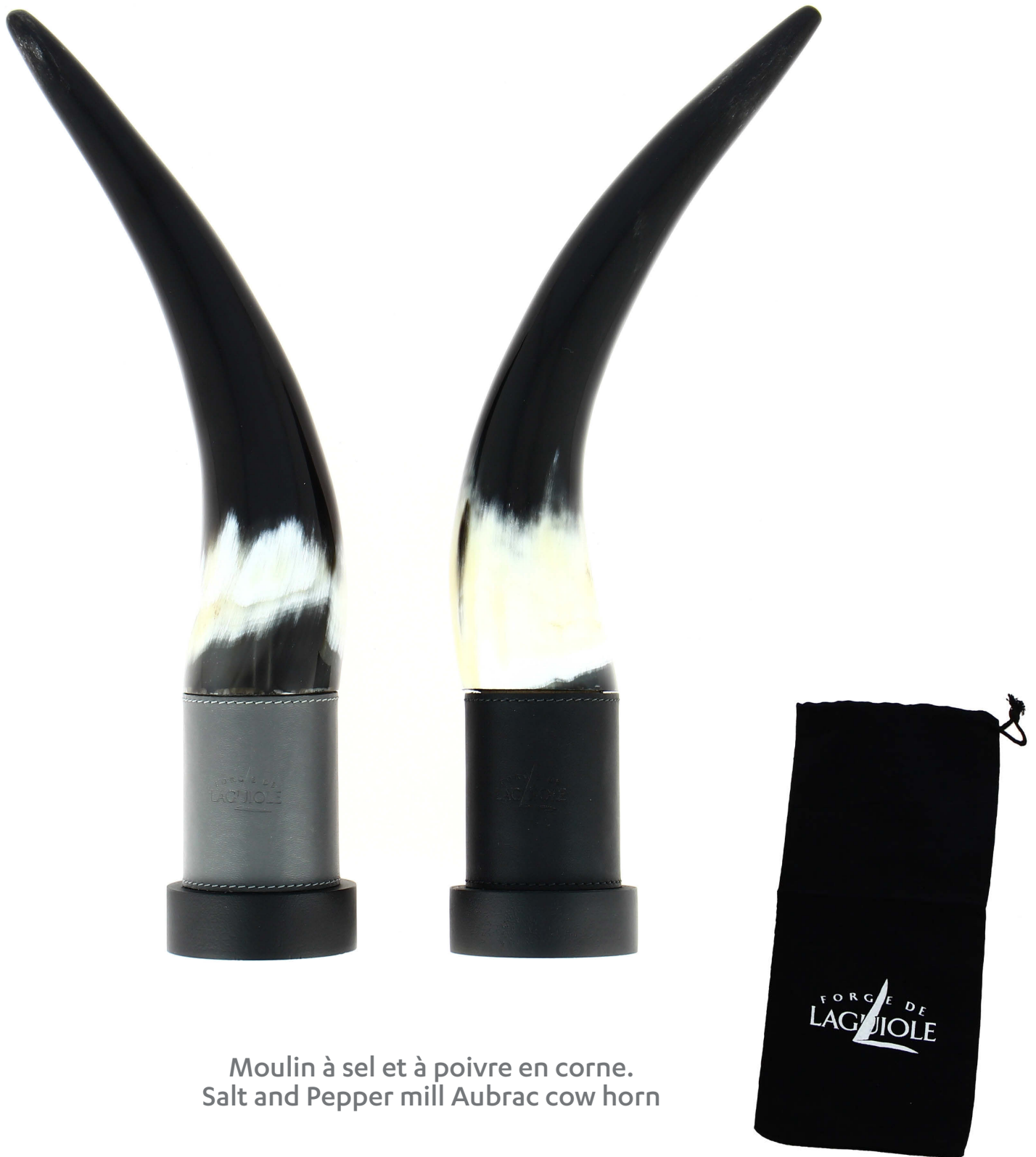
Moulin à sel et à poivre en corne. Salt and Pepper mill Aubrac cow horn